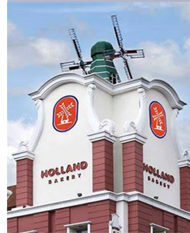
Supplier Utama Santan Holland Bakery Depok & Jakarta Utara